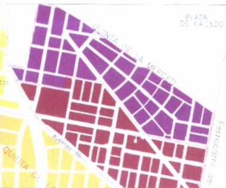
PLANO DE URBANIZACIONES

La arquitectura de cada una de las etapas caracteriza al barrio en sus subsectores. Esto matizado con la traza de calles curvas y no continuas le otorga a este barrio un carácter singular dentro del contexto urbano ampliado. Su dinámica económica amenaza desaparecer estas cualidades.