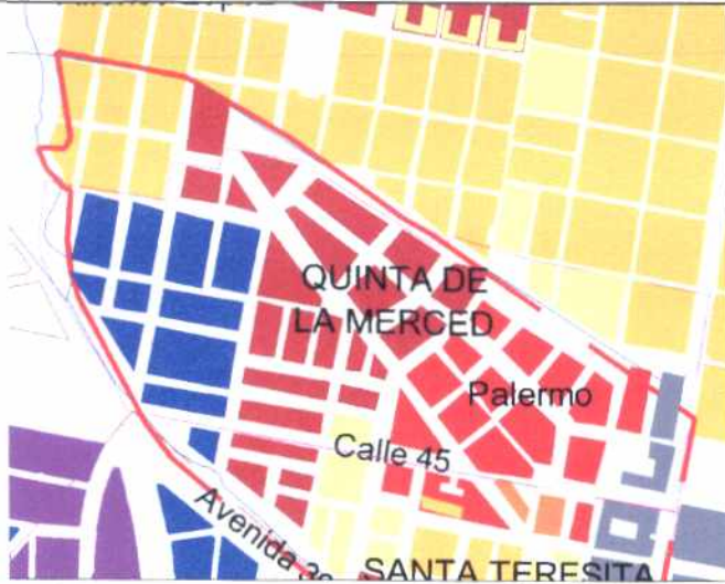
CRECIMIENTO HISTÓRICO - CRONOLOGÍA